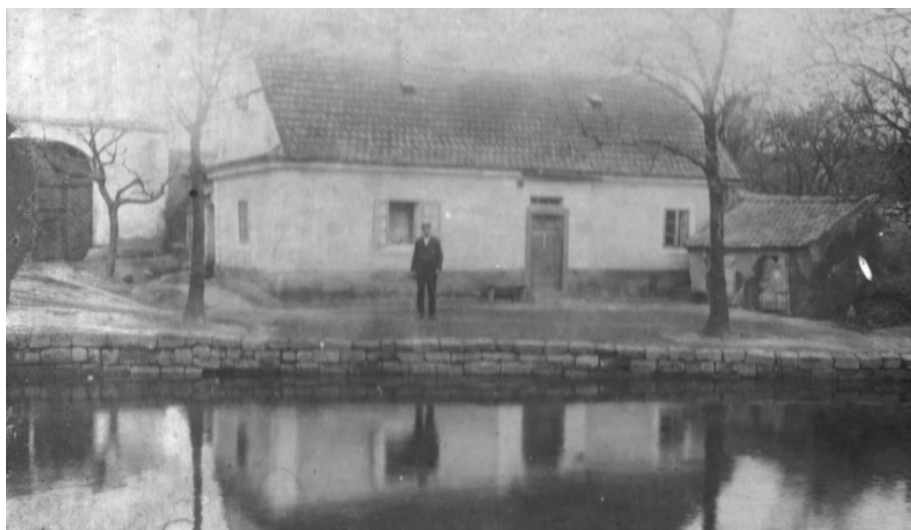
Pohled na domek č. 23 v ulici K Rybníčku z 30. let.