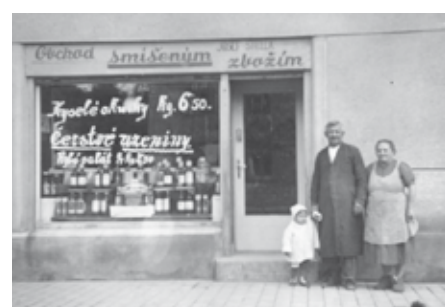
Obchod pana Štelly v ulici K rybníčku č. 5. Obchod fungoval do 40. let. (zapůjčila paní Kapinusová)