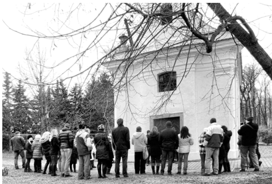
Zpívání na Štědrý den – začátek nové tradice?