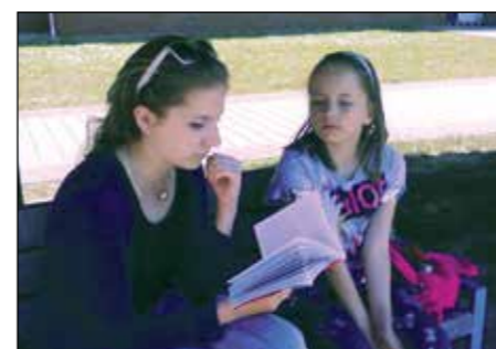
Projekt - Devátáci čtou prvňáčkům