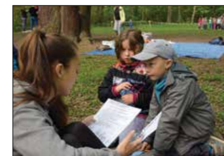
Závod tajfun I. stupeň