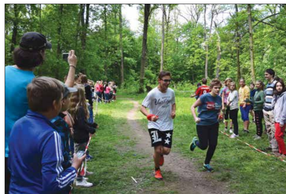
Závod tajfun II. stupeň