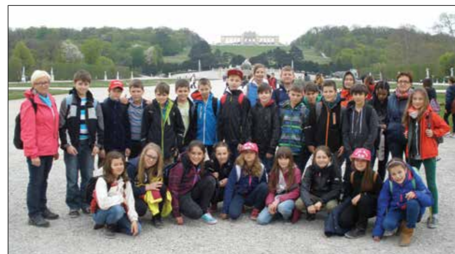
Pátáci ve Vídni