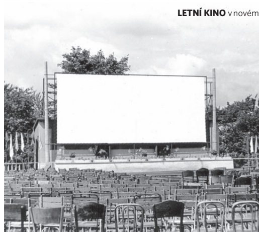
LETNÍ KINO v novém