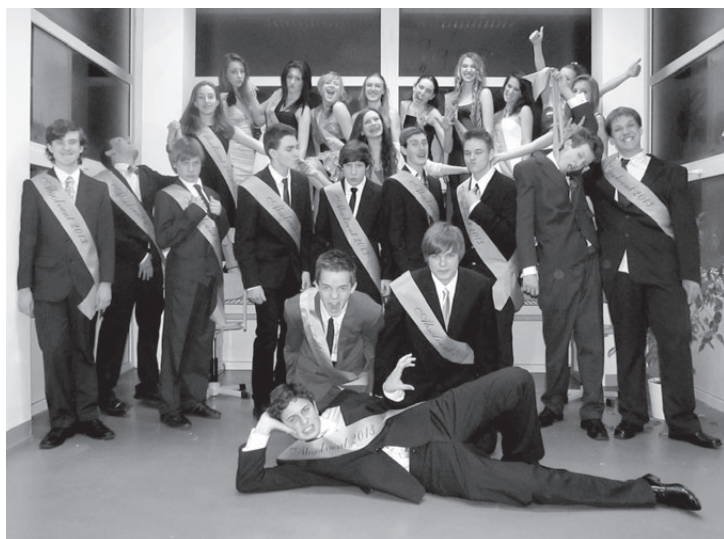
DEVÁTÁCI se za několik týdnů rozloučí se školou.

Občejná sobota 23. 3. 2013 se v základní škole v Satalicích proměnila v nešednou. Žáci školy se svými učiteli a vedoucími kroužků nacvičili program 11. Jarního plesu. „To nezvládnou, podívej těch lidí,“ říká žákyně před svým vystoupením. „Lidi je opravdu hodně, řekla bych tak 500 určitě,“ souhlasí další účinkující. „Ale ty to zvládneš, jsi šikovná stejně jako další, kteří vystupují, a není jich zrovna málo. Vem si tu gymnastku na koni, jak se to jen jmenuje - voltiž, nebo další gymnasty, vystoupení zumby a další.“ „To máš pravdu, ukážeme jim, co umíme,“ zasměje se a už poskakuje s ostatními nasčenu.