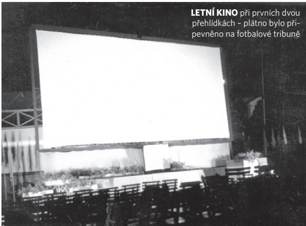
LETNÍ KINO při prvních dvou přehlídkách – plátno bylo připevněno na fotbalové tribuně