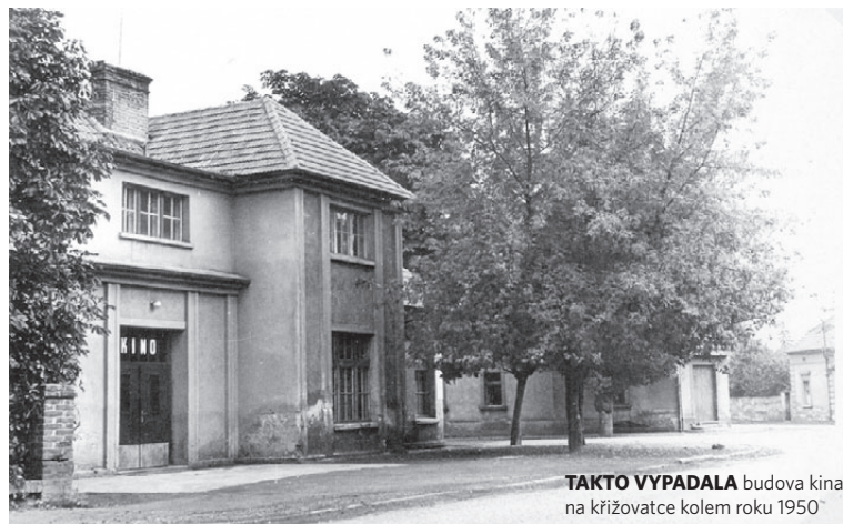
TAKTO VYPADALA budova kina na křižovatce kolem roku 1950